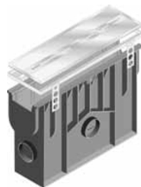
W&H - RECYFIX zandvanger zonder opstaande rand L x B x H 500 x 160 x 415 mm, 4,9 kg. Art. nr. WH7750